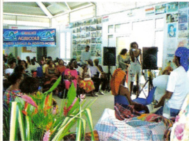
Un public nombreux au foyer socio-éducatif.