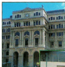
Photos extraites du CD-Rom réalisé par les élèves (Cuba Barbade...)