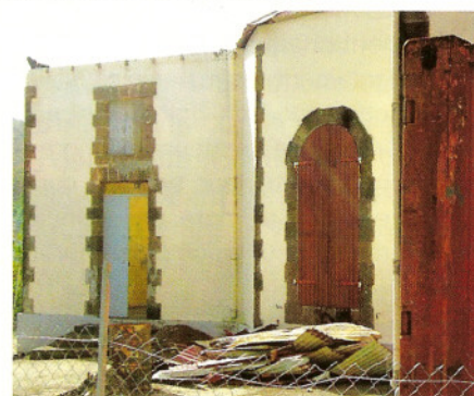
L'église en travaux